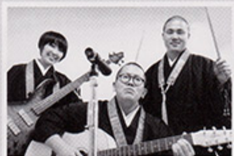
ぼくぼくすまいる